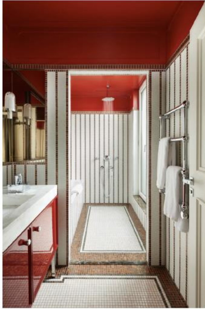
Il bagno è realizzato con mosaico, ma a far da padrone è il colore rosso-rosa.