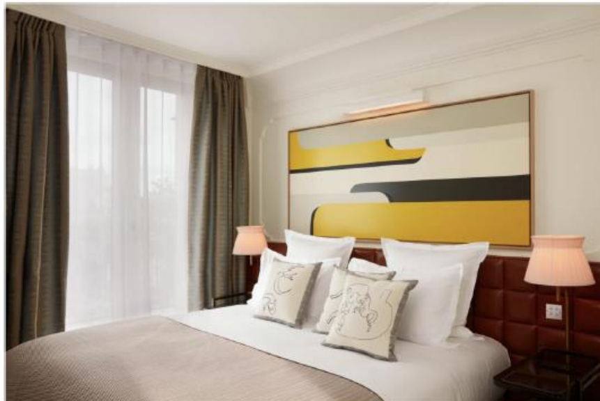
Ogni camera evoca l'atmosfera di un appartamento parigino con pezzi d'arte.