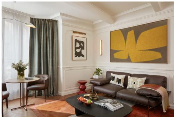
Per ogni spazio sono state selezionate opere d'arte realizzate ad hoc per l'hotel.

Colpisce subito la facciata del vecchio condominio costruito nel 1911, che è stata interamente ristrutturata, in pietra tagliata e finemente lavorata, punteggiata da balconi e bow window.