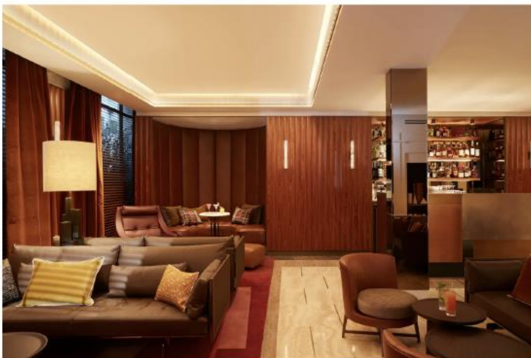
L'area lounge ha un'atmosfera calda e accogliente come a casa, con pezzi di design, opere d'arte e libri.

Uno spazio da vivere come una dimora d'artista. L'ampia e accogliente area lounge evoca infatti il salotto di casa, con divani, poltrone, lampade da terra e da tavolo, quadri, oggetti di design e libri. Le pareti sono rivestite con pannelli di palissandro e i soffitti con motivi geometrici in stucco; a pavimento, l'uso giocoso dei materiali alterna il travertino chiaro al marmo nero Saint Laurent. Mentre al bar, arredi in pelle, legno e ottone spiccano sopra tappeti di grandi dimensioni. Il patio, racchiuso invece da una parete di vetro curvilinea, si apre su un giardino verticale dove affacciano le camere.