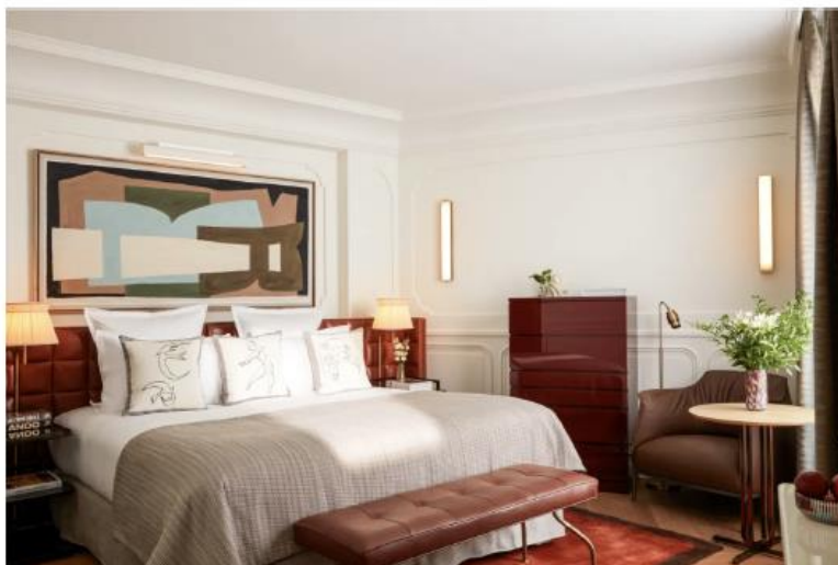
In ogni camera si trova un'opera d'arte sopra la testata del letto. Diversi elementi sono stati realizzati su misura per dare un tocco unico e personale.