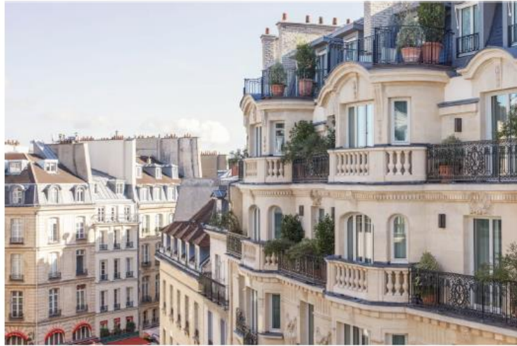
La facciata del vecchio condominio costruito nel 1911 è stata interamente ristrutturata.