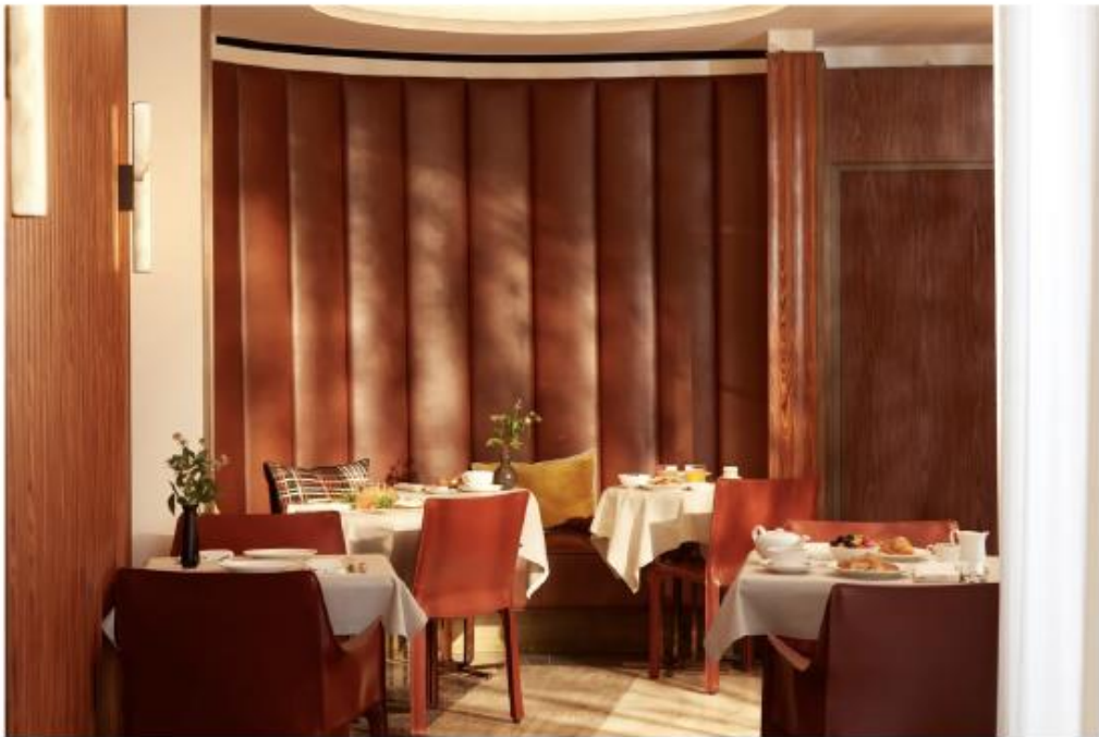
Un angolo dell'area comune dedicata alle colazioni, aperitivi e drink. Ogni elemento è stato studiato con cura per creare un'atmosfera di casa.